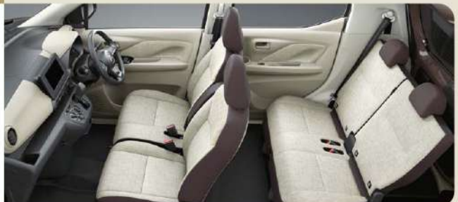
Photo:eKワゴン M 2WD ナビ取付パッケージ装着車 ボディカラー:オークブラウンメタリック(有料色:33,000円高/消費税抜価格:30,000円高) ●撮影のために点灯 ●インテリア写真はカットボディによる撮影