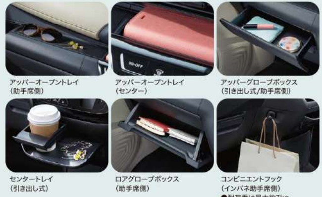
アッパーオープントレイ (助手席側)